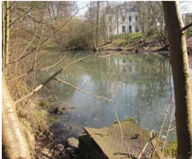
Einer der Alsterteiche Höhe Torhaus (milchig-trüb).

Aktuelle Informationen zum Beteiligungsprozess finden Sie immer unter: www.lebendigealster.de .